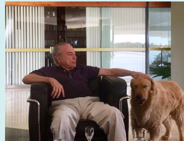
Michel Temer e o cão Thor: foto postada no domingo segue tingindo as redes sociais de suor