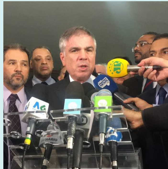
Flávio Rocha, da Riachuelo, anuncia pré-candidatura ao Planalto: “Serei o representante do conservadorismo nos costumes”